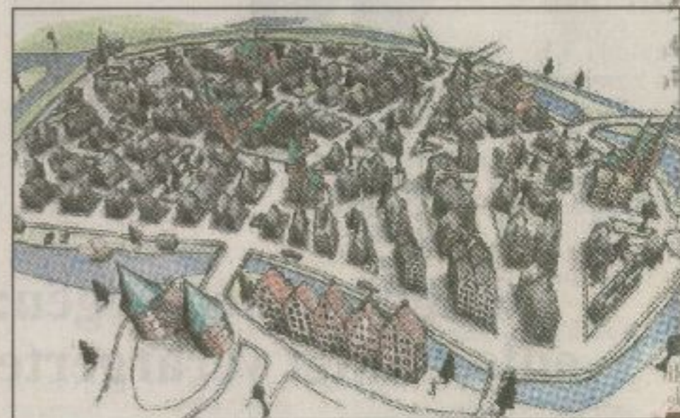
So kennen wir Lübeck: Wo 150 Jahre zuvor die Stadtmauer stand,