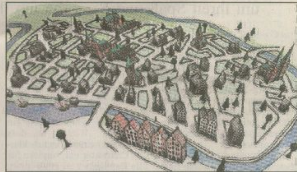
Zur Hochzeit der Hanse um 1350 sind bereits erste Straßenzüge auszumachen. Deutlich sind die Salzspeicher, der Dom und die Petrikirche zu erkennen. Lastkähne schippem auf der Trave.