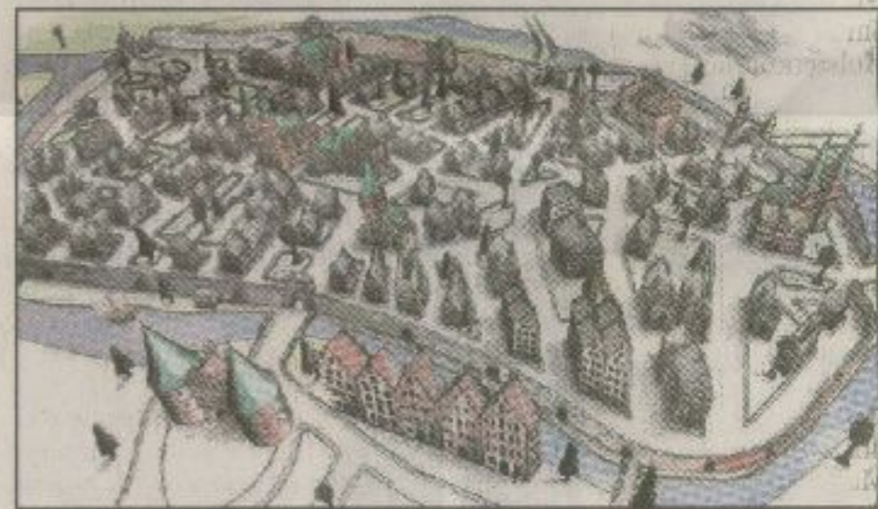
Knapp 200 Jahre später, um 1850, ist das Vortor des Holstentores bereits Geschichte. Innerhalb der Stadtmauer wird mit Einsetzen der Industrialisierung der Bauplatz rar.