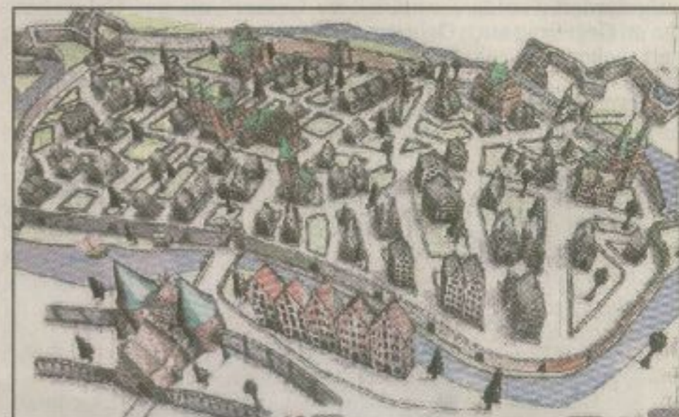
Um 1675 gewinnt die Altstadt langsam an Konturen. Das Holstentor, Lübecks späteres Wahrzeichen, ist zum festen Bestandteil mächtiger Befestigungsanlagen geworden.